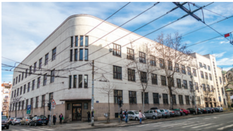
Prva muška gimnazija, arh. Milica Krstić, 1936–1938.

otvorena i osvećena 27. aprila 1938. godine. (АНОНИМ 1938b, 5) Po otvaranju nove zgrade Prve muške gimnazije u novinskim člancima je naglašavana činjenica da je građevina projektovana prema najsavremenijim principima arhitekture školskih zgrada, sa veoma dobro osvetljenim i prostranim učionicama. (АНОНИМ 1938a, 441) 37 Građevina se prostirala na površini od 3.522 m 2 , osnove u obliku ćiriličkog slova P koje omeđuje školsko dvorište. (Николова 2018, 72) Uglovi su naglašeni svojom konveksnom formom, dok je pročelje dinamizovano asimetrično pozicioniranim glavnim ulazom i stepenišnim traktom iza niza prozorskih otvora koji formira vertikalnu kontratežu inače izrazito horizontalnom zdanju. (Putnik Prica 2018b, 1020) Škola je imala 17 učionica, amfiteatar, gimnastičku salu, kabinet za crtanje, biblioteku, ambulantu, salu za pevanje i ostale neophodne prostorije. (АНОНИМ 1938a, 441; Николова 2018, 72)