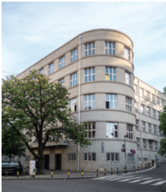
Prva ženska gimnazija, arh. Predrag Zrnić, 1936–1938.

koja predstavljaju čas muzike, čas crtanja i saznanje. Alegorijske kompozicije je u estetskim okvirima ar dekoa izradio vajar Dejan Bogdanović. (Sikimić 1965, 41) Njihova simbolika aludira na obrazovnu ulogu gimnazije, a činjenica da su protagonisti reljefa isključivo ženskog roda dodatno podcrtava činjenicu da je gimnazija namenjena devojkama.