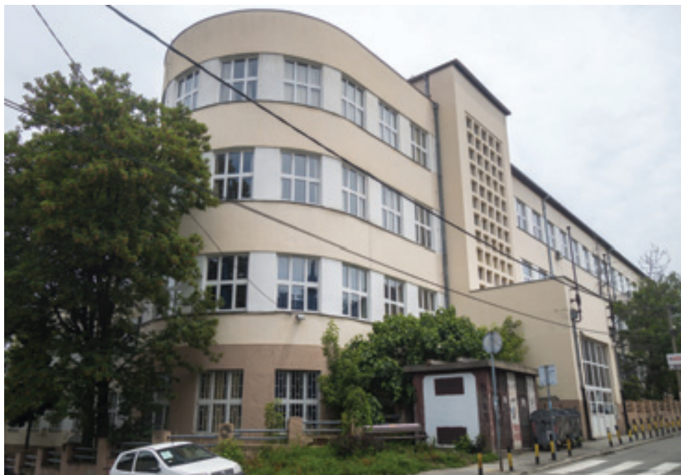
Šesta muška gimnazija, arh. Predrag Zrnić, 1937–1943.

poziciju desnog krila pročelja, dok je duž levog krila smešten niz učionica i sporedni ulaz. Na oba kraja pročelja su bočna krila koja omeđuju unutrašnje dvorište škole. Ugao Milana Rakića i Đevđelijske je dodatno akcentovan zaobljenim uglom, koji je Zrnić takođe iskoristio na prethodno projektovanoj Prvoj ženskoj gimnaziji. I ovde je u suterenu bilo projektovano sklonište protiv vazдушnih napada, ali i radionice za praktičnu nastavu i stanovi za domare. U prizemlju i na spratovima se nalazilo 14 učionica, sala za crtanje, dva amfiteatra, kabineti, profesorske kancelarije, gimnastička sala, svečana sala i ambulanta. U svečanoj sali su bile pozornica, galerija i kinematografski aparat. Sve učionice bile su opremljene malim garderobama, dok su podovi bili pokriveni plastelit-kaučuk asfaltom koji je bio lak za održavanje. (Аноним 1941, 10)