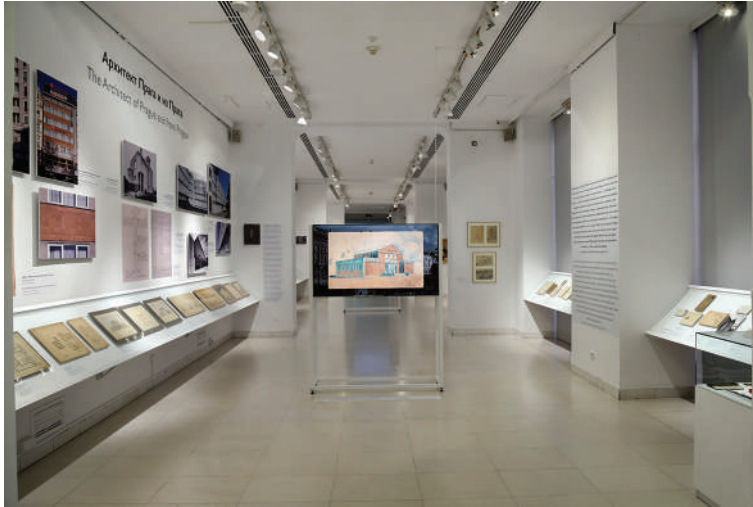
Marina Dokmanović, Postavka izložbe (segmenti) Nikola Dobrović: pod zastavama modernih pokreta (Galerija Srpske akademije nauka i umetnosti (GSANU), Beograd, 24/05/2022 – 02/10/2022).

pozadini na suprotnom delu slike stoji slikar Petar Dobrović. Takođe su bile izložene slike ulicâ u Pečuju, rodnom gradu Nikole Dobrovića i u Dubrovniku, izabrane ne samo kao svedočanstva o prostorima u kojima je boravio u određenom periodu života, školovao se i stvarao, već je ulica odabrana i kao bitni element svih, pa i ovih gradova, dok je slika stare masline izdvojena i prezentovana zbog simbolike koju nosi, ali na prvom mestu kao drvo – po rečima Nikole Dobrovića – najvažnije prirodno pomagalo u formiranju gradskog pejzaža i zelenog prostora u javnom diskursu međuratne modernizacije gradova.