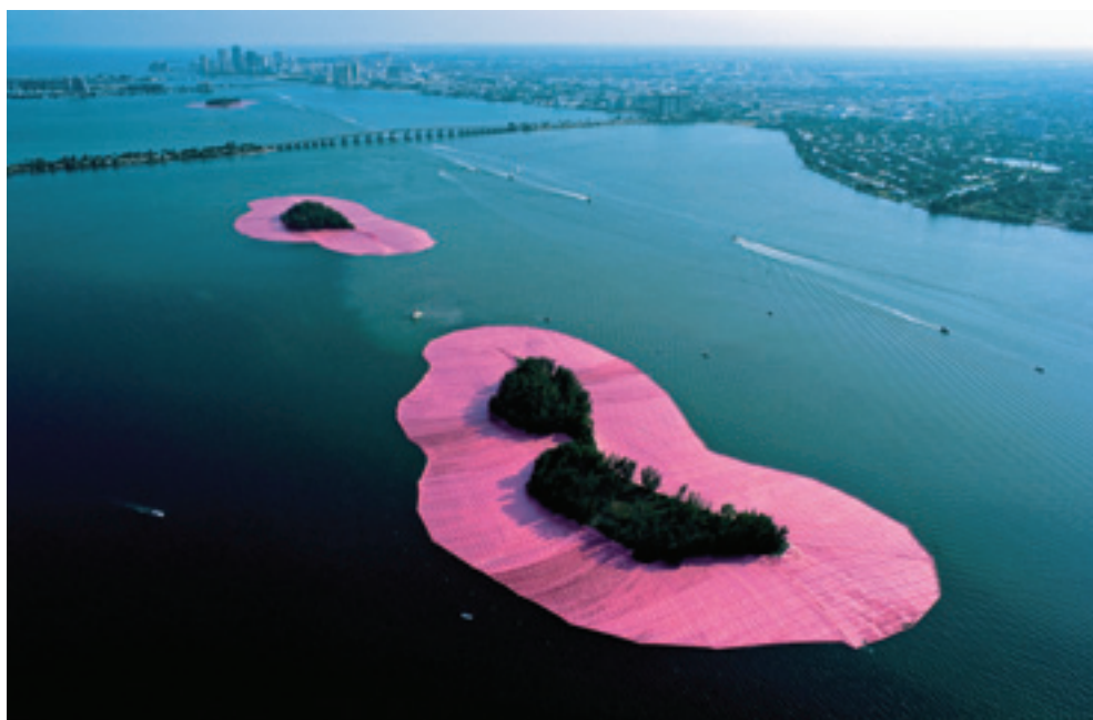
Christo and Jeanne-Claude, Okružena ostrva, Biskejn zaliv, Majami, Florida, 1980–83