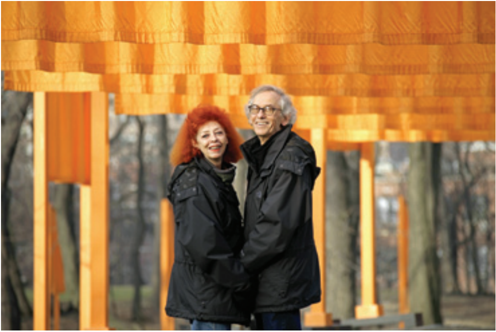
Kristo i Žan-Klod pred instalacijom Kapije (The Gates), Njujork, februar 2005, Foto: Wolfgang Volz © 2020 Estate of Christo V. Javacheff

sa komesarima da nakon postavke potpišu 1000 fotografija od čije će se prodaje novac koristiti za zaštitu zaliva Biskejn. (Kane 2018)