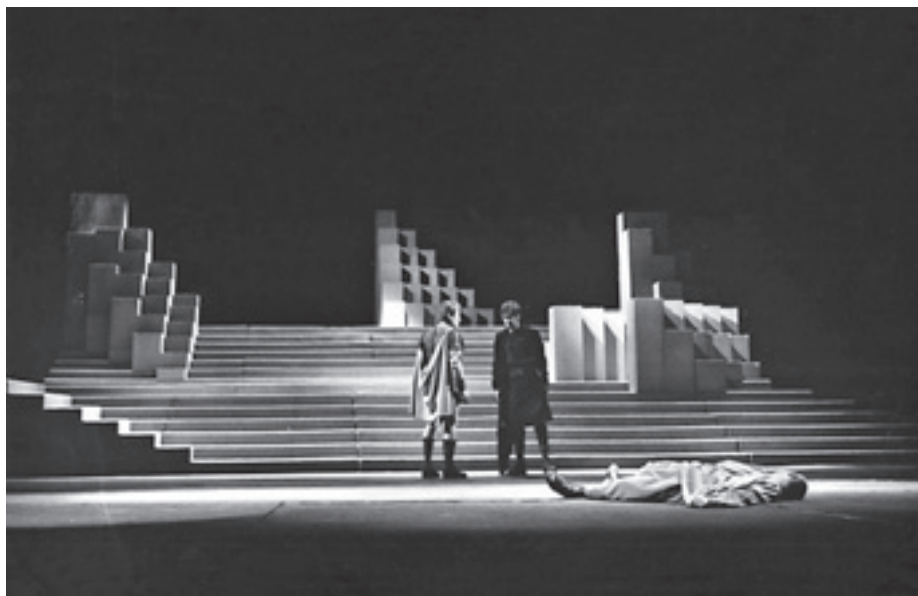
Scena iz drame Julije Cezar W. Shakespearea sa scenografijom Vjenceslava Richtera i Koste Spaića, 1970.

pozornici. Poput Glumca, Richter i Spaić također su posegnuli za monumentalnim stepeništem prikladnim za kretanje masa te prekrivanjem orkestra proširili prostor prema gledalištu. Arhitektonika scene i apstrahizirani scenski prostor bili su dinamizirani plastičkim formama nalik na fragmente Richterovih transformabilnih reljefometara i fiksnih sistemskih skulptura čije je vizualne mogućnosti istraživao 1960-ih i 1970-ih. Scenografija Julija Cezara primjer je uspješnog prevođenja estetike Novih tendencija i aktualnih vizualnih i plastičkih istraživanja u domenu kazališne umjetnosti te Richterova intermedijalnog pristupa koji je podrazumijevao paralelno promišljanje prostornih i oblikovnih mogućnosti „na nekoliko područja – u mikro (skulptura) i makro dimenziji (arhitektura)“ (Magaš 2010, 266), 12 ali i u scenografiji.