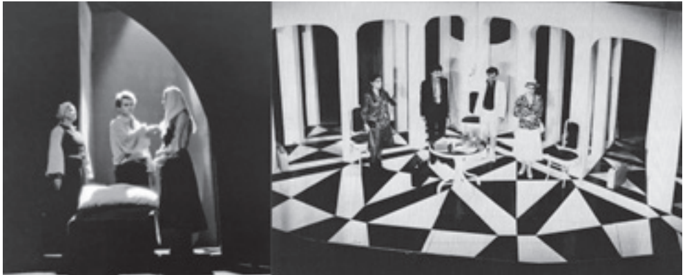
Scene iz komedije Bakonja fra Brne S. Matavulja, 1978, Gradsko kazalište Trešnja 1999, 80. / Scena iz komedije Tko je tko? K. Waterhousea i W. Halla, 1981, Satiričko kazalište Jazavac 1964–1984 1984.