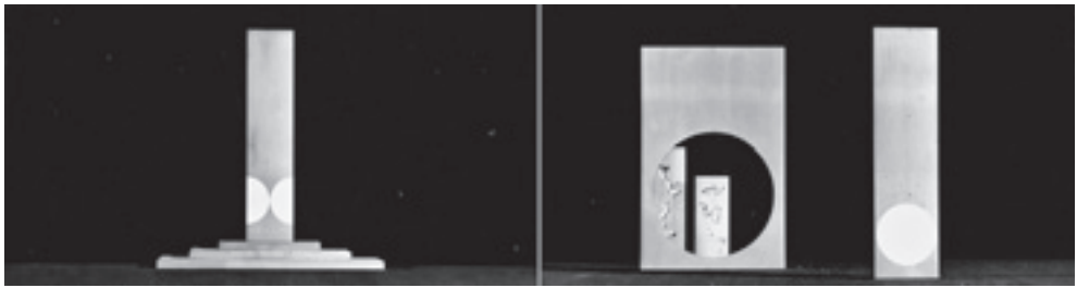
Vjenceslav Richter, Makete scenografije za balet Remi D. Gostuškog, 1963, Arhiv Vjenceslava Richtera, MSU Zagreb

Richter će apstrahizaciju scene na igru geometrijskih oblika primijeniti u inscenaciji baleta Remi Dragutina Gostuškog za koji je kostime radila Jagoda Buić, a režiju i koreografiju potpisao Zvonko Reljić. Premijera jednočinke u četiri slike održala se 15. svibnja 1963, a sačuvane su samo fotografije nekoliko verzija maketa koje prikazuju suodnose pravokutnih formi sa svjetlosnim ili perforiranim krugovima / polukrugovima iz kojih se može naslutiti da je Richter razmišljao u smjeru apstrahizacije scenskog prostora i stvaranja neutralnoga vizualnog okvira za pokret izvođača. Glazbena dionica Gostuškova baleta doživjela je snažne negativne kritike, pri čemu je istaknuto kako nije osigurala dovoljno jasan okvir za gradnju ostalih elemenata predstave te nije „davala nikakve jasne smjernice za likovnu postavku“ (Selem 1963, 7).