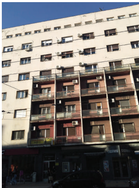
Branislav Marinković, Stambena zgrada, ugao Vasine ulice i Studentskog trga, 1952.