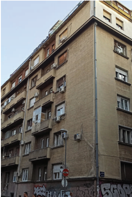
Branislav Marinković, Stambeni blok, ugao Gospodar Jovanove, Cara Uroša i Rige od Fere, 1949. (fotografija autora)

Njegovo poslednje ostvarenje u duhu socrealističke estetike predstavlja stambeni blok na uglu Gospodar Jovanove, Cara Uroša i Rige od Fere (1950). Nekadašnji neparni front Ulice cara Uroša s prizemnim i jednospratnim kućama ustupio je mesto savremenim stambenim objektima na oba ugla sa Gospodar Jovanovom ulicom, pa je tako Marinkovićev objekat